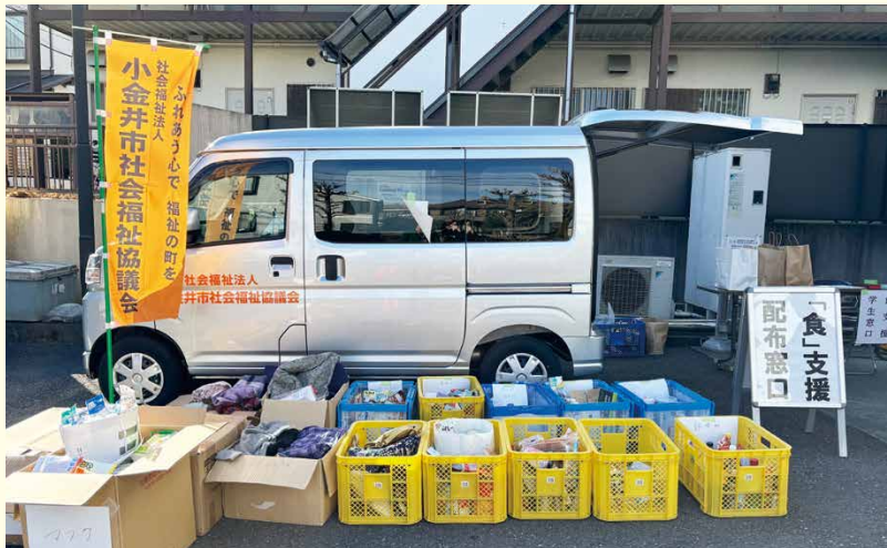
※写真は昨年度実施時のものです

消費期限、賞味期限は令和8年1月以降のもので、 調理方法が簡易な以下の食品 ・インスタント食品、レトルト食品、缶詰、乾麺、米、餅等