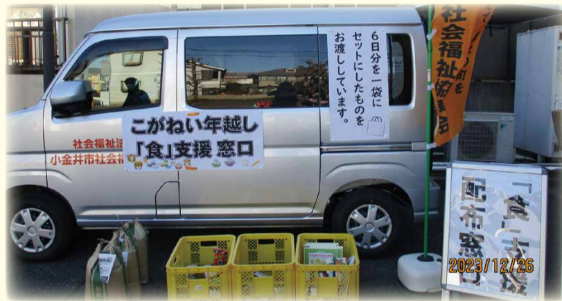
※写真は昨年度実施時のものです

配布期間:令和6年12月25日(水)、26日(木)、27日(金) 各日9:00～18:00 配布場所:社会福祉協議会 駐車場奥